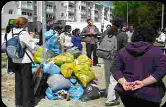
Jornadas de limpieza y sensibilización