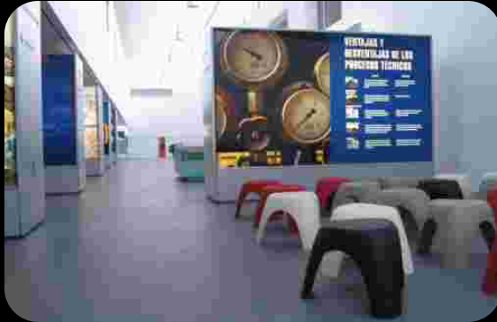
Centro de visitantes