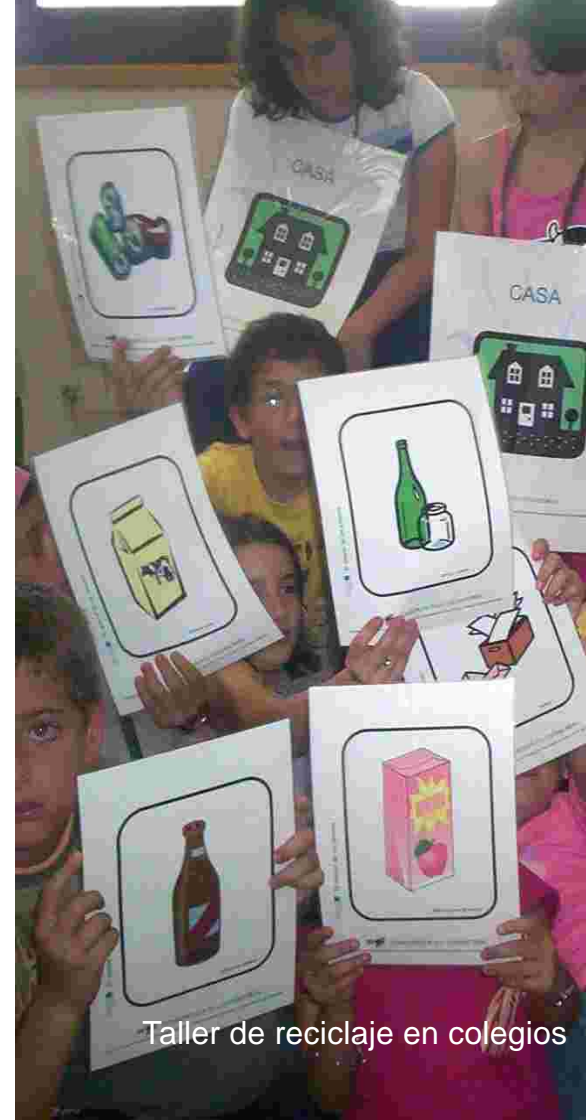
Taller de reciclaje en colegios