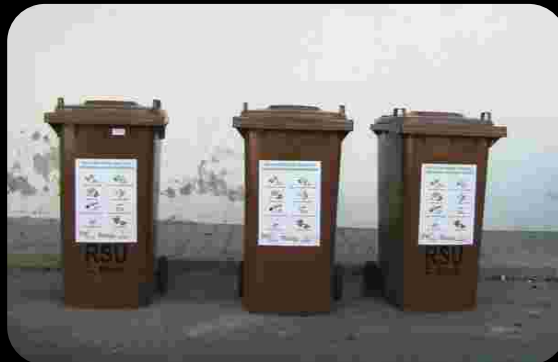
Contenedores de materia orgánica