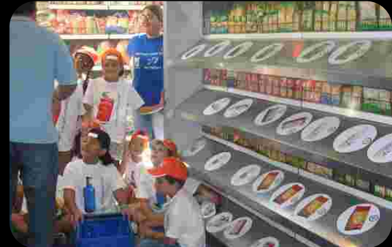
Juego de compra sostenible