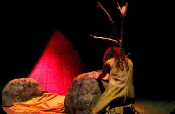
Teatro sobre reciclaje de residuos