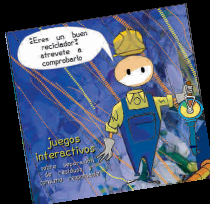
Cdrom de juegos interactivos sobre reciclaje de residuos

Materiales y publicaciones sobre residuos y reciclaje