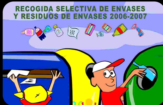
Imagen de cartel informativo de campaña escolar

Talleres para escolares sobre reciclaje y consumo responsable