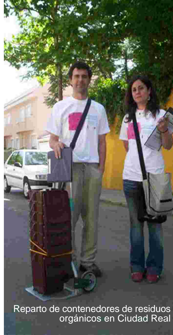
Reparto de contenedores de residuos orgánicos en Ciudad Real