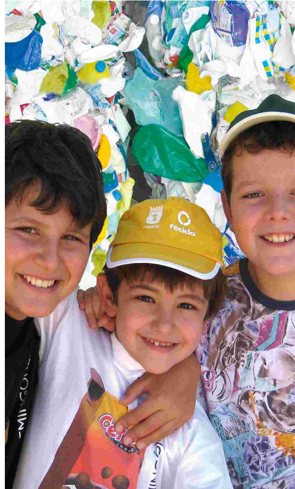
Imagen campaña publicitaria Ecoembes