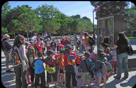
Taller en el Parque del Retiro de Madrid