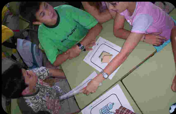
Actividad escolar sobre reciclaje