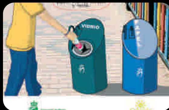
Imagen de cartel informativo de limpieza viaria

Actuaciones en campañas de sensibilización sobre residuos