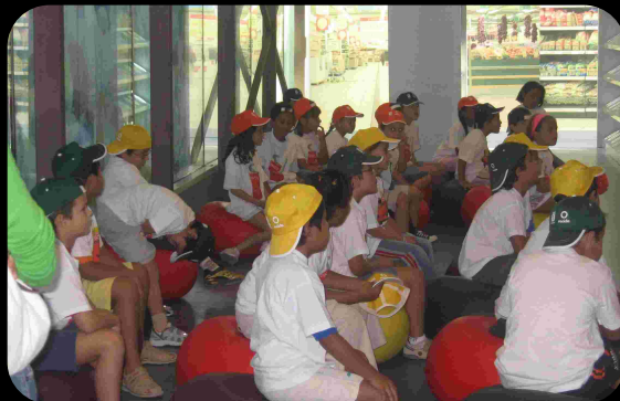
Taller en Aula Infantil de Valdemingómez