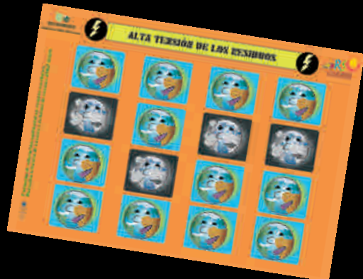
Tablero de juego sobre residuos