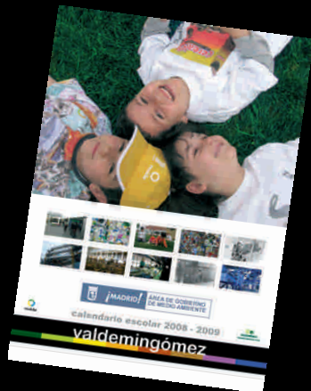
Calendario escolar 2008-2009